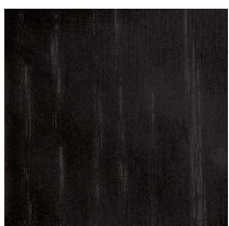
Frassino tinto nero poro aperto