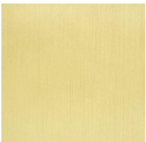
Laccato ottone satinato